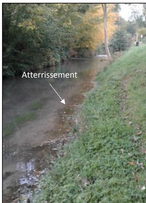
Secteur avant aménagement

La présence d'atterrissements sablo-vaseux sur ce parcours a permis d'envisager la création de banquettes végétalisées afin de diversifier les techniques de resserrement du lit du cours d'eau.